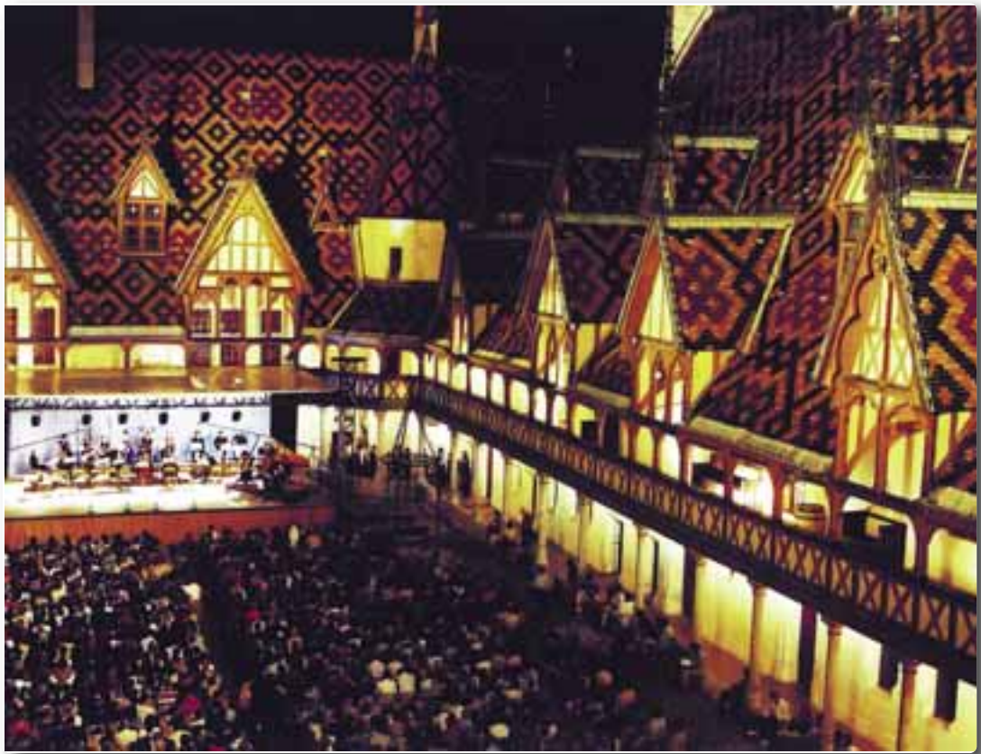
Cour des Hospices de Beaune en concert